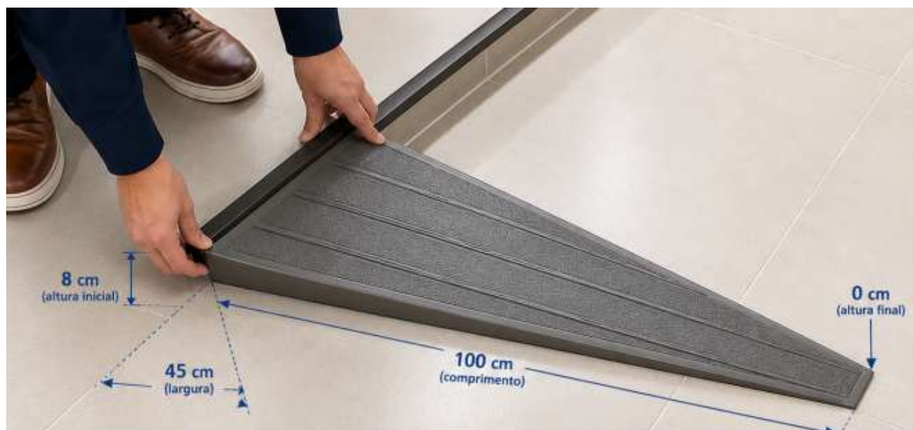
VISTA SUPERIOR (PLANTA)